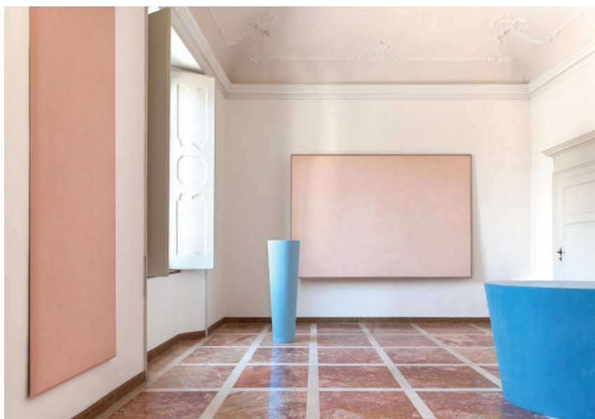
Villa e Collezione Panza, Ettore Spalletti Room