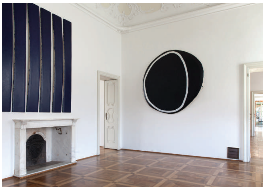
Villa e Collezione Panza, Equally Possibilitie's Prevail by Allan Graham Photo by arenaimmagini.it, 2013 © FAI – Fondo per l'Ambiente Italiano

Oltre duecento opere di artisti americani ed europei, ispirate ai temi della luce e del colore, convivono in armonia con gli ambienti storici, gli arredi rinascimentali e le preziose raccolte di arte africana e precolombiana. Ogni cosa è come la volle Giuseppe Panza che prima di morire lasciò indicazioni perfette su come Villa Panza dovesse essere allestita con la sua meravigliosa collezione. Inoltre insieme alla moglie nel 1996 donò la Villa al FAI per poterla rendere patrimonio fruibile dal mondo intero.