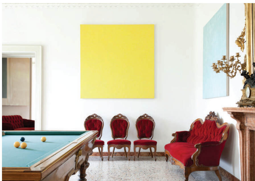
Villa e Collezione Panza, Biliard Room, Untitled by Phil Sims, Photo by arenaimmagini.it, 2013 © FAI Fondo per l’Ambiente Italiano

Così il sito offre una collezione permanente, con opere straordinarie che hanno dato vita a “un luogo che rappresenta il cuore della cultura europea e al tempo stesso l’unione tra l’Europa e l’America nella sua più piena espressione” (Wim Wenders).