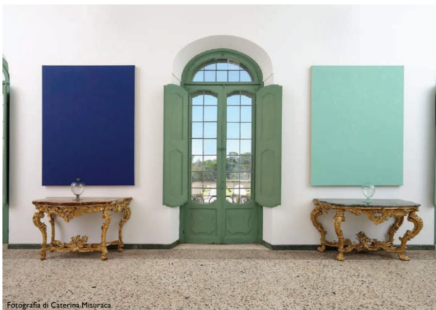
Villa Panza